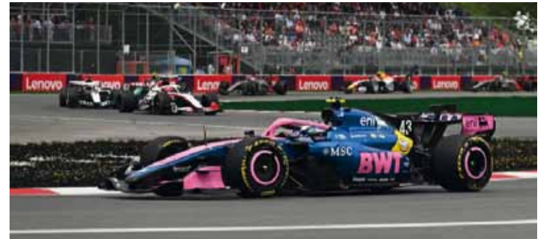
Carrera. Franco afronta otro fin de semana intenso.

Buscará sostener el buen momento de Alpine en uno de los circuitos más exigentes.