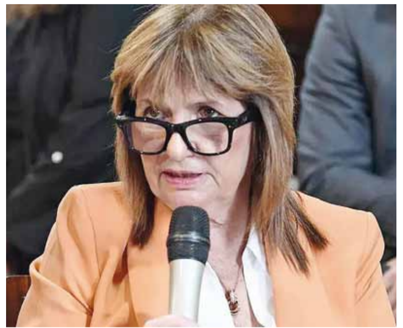
Complicaciones. La interna demoraría la aprobación de unos 70 pliegos que estaba previsto votar en la sesión de mañana.