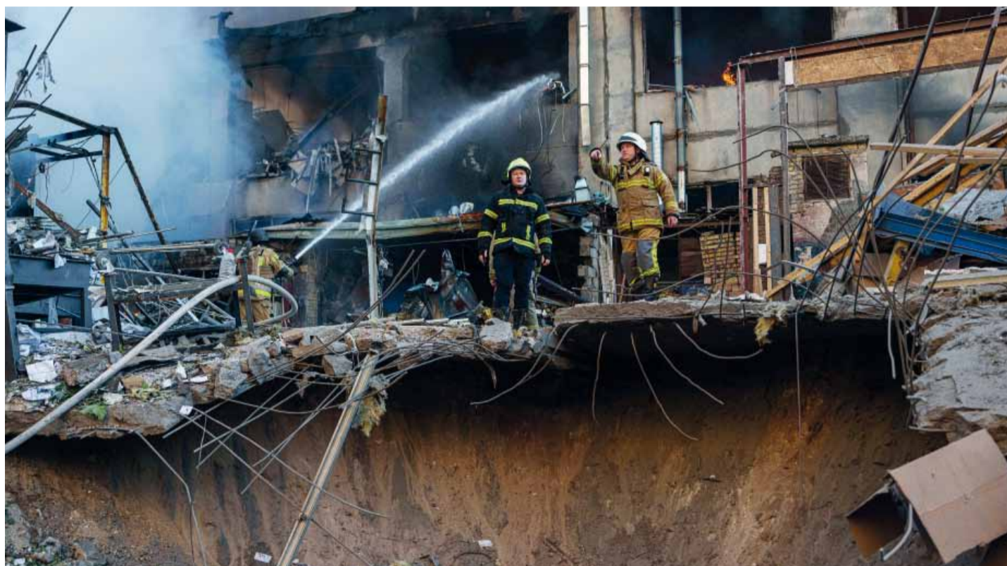
Entre las víctimas fatales hay un niño y un rescatista que murió durante un segundo ataque mientras asistía a los afectados.

tario, sumada a su rechazo al retiro del pliego como jueza de Verónica Michelli impulsado por Karina Milei, abrió una fuerte disputa dentro del oficialismo que ya genera repercusiones entre aliados y bloques dialoguistas. Página 3