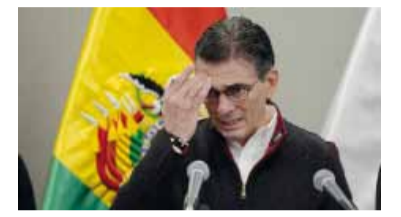
Proponen adelantar un referéndum revocatorio.

Bolivia: crece la presión sobre Rodrigo Paz