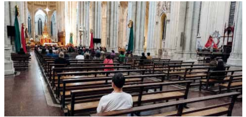
Descenso. Bajó el número de feligreses.

El informe del Observatorio de las Creencias en Argentina de la UBA muestra una caída de la identificación con el catolicismo en los últimos años.