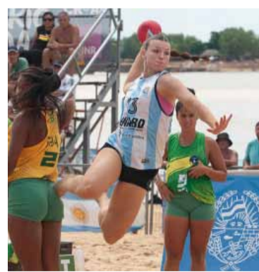
Kamikaze. Hora de la verdad.

Será la quinta participación mundialista para el beach handba-