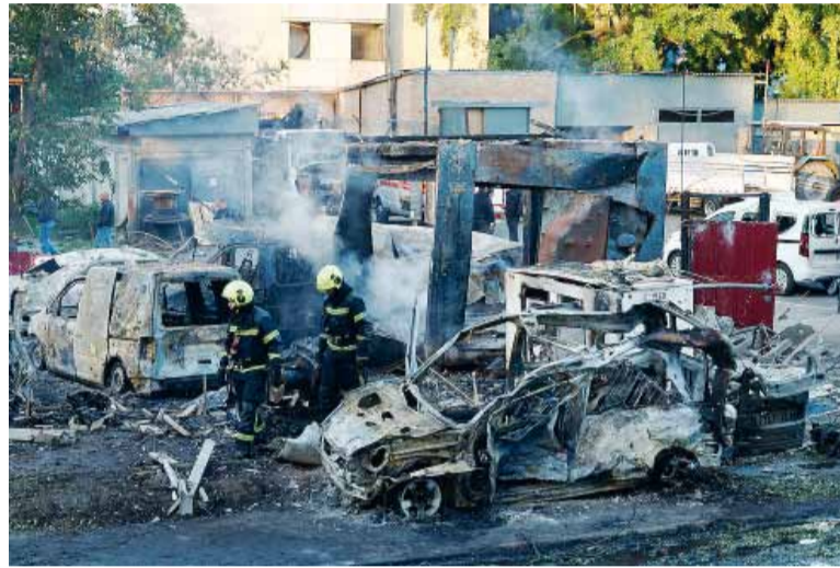
Dnipró. Fue la ciudad más castigada: se registraron 16 muertos y 42 heridos.

Uno de los episodios más graves ocurrió en el distrito de Podil, donde un edificio de viviendas sufrió un colapso parcial. Según denunció el alcalde Vitali Klitschko, el inmueble fue alcanzado mediante una táctica conocida como "doble golpe", que consiste en lanzar un segundo proyec-